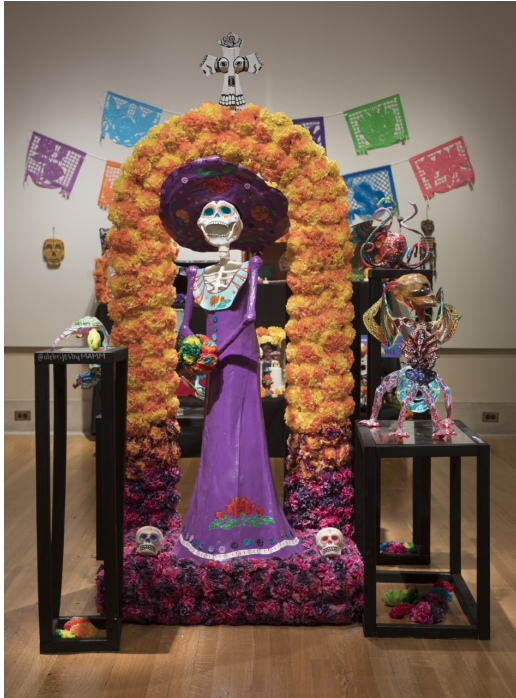
Los alebrijes también celebran, 2018, Mario Alberto Martínez Mendez.

El Instituto de Artes de Detroit, en colaboración con el Consulado de México en Detroit, exhibe cada año una exposición comunitaria de altares de ofrenda en celebración del Día de Muertos. En México y otros países latinoamericanos el Día de Muertos es el momento del año en que se celebra la vida de seres queridos, amigos o miembros de la comunidad que han fallecido.